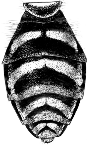
图 16 中华长角蚜蝇 Chrysotoxum chinense Shannon 腹部 (背面观) (abdomen in dorsal view)